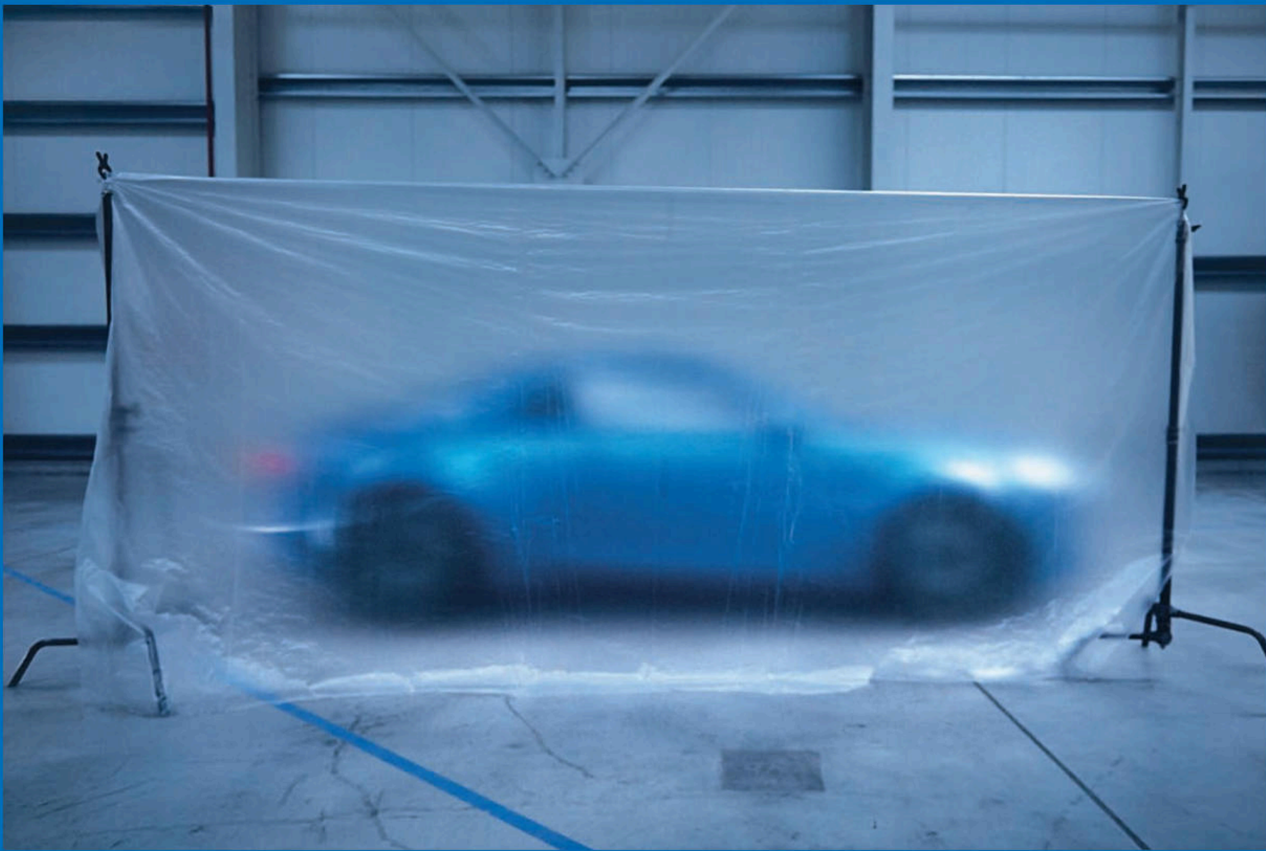
Photographiée à l'usine Alpine de Dieppe, janvier 2017. www.alpinecars.com

RCS Dieppe 662 750 074 - Crédits photo : © Sean Klingelhofer - Benoit Palley - Imprimé dans l'UE - Ne pas jeter sur la voie publique - Mars 2017. Tous droits réservés. La reproduction sous quelque forme ou par quelque moyen que ce soit de tout ou partie de la présente publication est interdite sans l'autorisation écrite préalable d'Alpine.